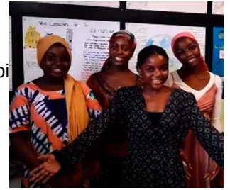
Photo : Collège de Dzoumogné lauréat 2022

Festival international de l'image sous marine 2024 :