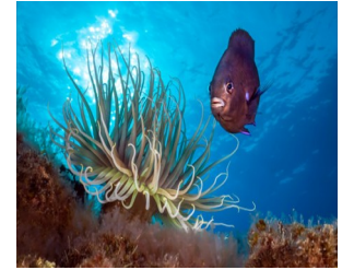
HIPPOCAMPE D'OR 2022

Règlement et inscription : https://fiismm.com/presentation-concours/